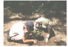
※植林体験時の写真です。

近畿木造住宅協会では、この度『国産材産地・工場見学ツアー』を開催致します！ この機会に森の“あたたかさ”に触れてみませんか。 国産材を活用した住宅の利用促進に向けて、工務店等建築技術者様の 木材に関する理解と活用を図る為の見学会です。 工務店経営者様・現場監督様をお誘いあわせの上、是非ご参加下さい！